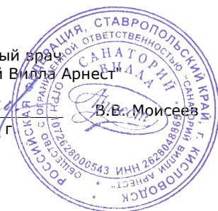
ГРАФИК работы лечебно-диагностического отделения ООО «Санаторий Вилла Арнест»